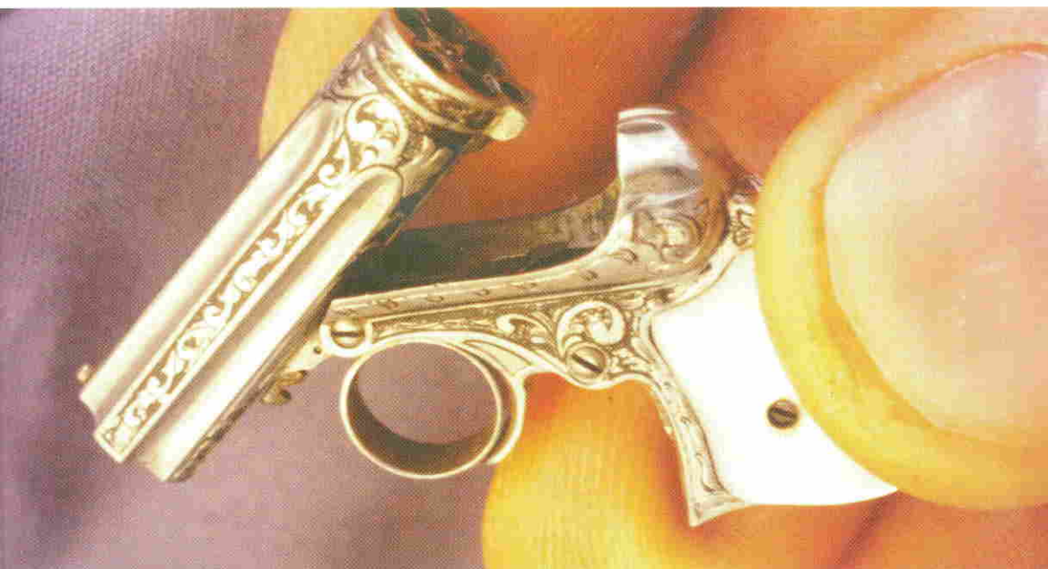
Remington Derringer, à l'échelle de 1/3